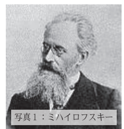
写真1：ミハイロフスキー

西洋資本主義社会の分業体制下におかれた人間（労働者）は、社会の一部として、あるいは部品として生きることを余儀なくされる。しかし裕福な資本家や貴族ならぬ人々は、それで